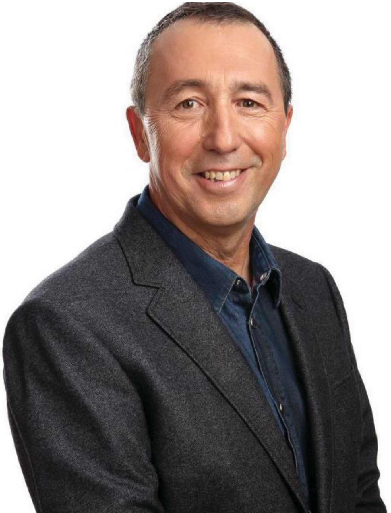
Joan Baldoví i Roda. Diputat de la Coalició Comrpomís al Congrés dels Diputatas.