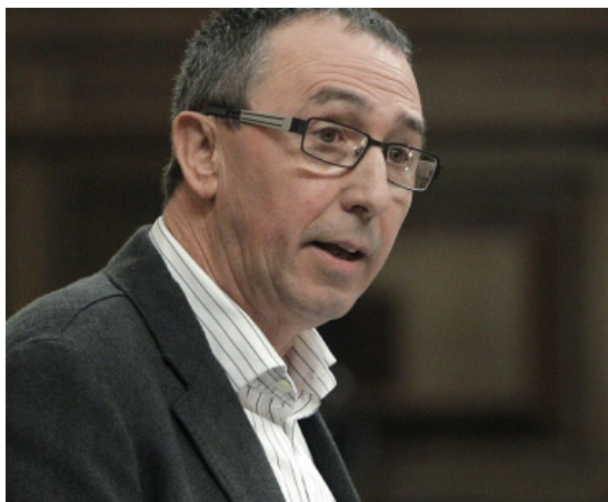
El diputat de COMPROMÍS , Joan Baldoví